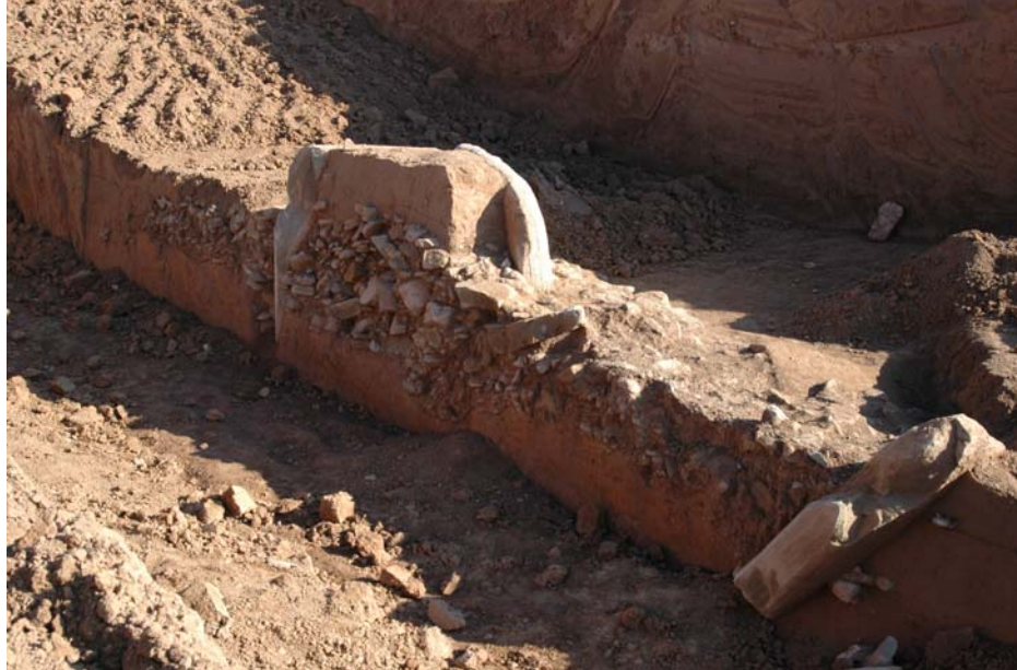
Una imatge del megàlit de Seró