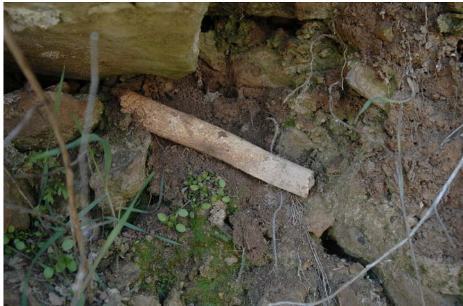
Unes restes aflorades aquests darrers dies

Alguna vegada s'han sentit al poble veus de veïns reclamant el desmantellament del cementiri i el trasllat de les restes al nou cementiri del poble. A la vista de la situació, cada cop te més sentit aquesta proposta.