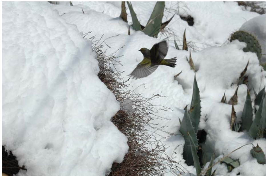
Volant a la recerca de menjar

Al final d'hivern, els mascles es fan notar pel seu cant ràpid i eloqüent, que solen cantar des de l'extrem superior dels arbres despallats de fulles, o des d'altres punts elevats i visibles