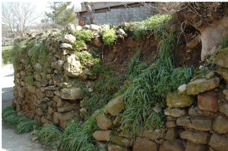
Caiguda de pedres del cementiri

Tot sovint es produeixen noves caigudes de pedres dels límits d'aquest cementiri. El terreny que ocupa està elevat sobre la resta que l'envolta i els seus límits estan tots envoltats per una paret seca de pedres. Aquesta paret està formada, en diversos llocs, per diferents capes verticals i paral·leles de pedres.